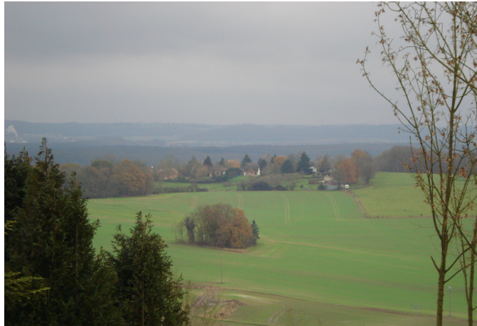
Composition du « Pays du Grand Beauvaisis »

A contrario, le « Pays » doit représenter un espace avec une « cohésion géographique, culturelle, économique ou sociale ». Il doit être un outil stratégique à la disposition des élus, leur permettant de mettre en oeuvre des actions et des projets d'intérêt communautaire. Le « Pays » devient alors le cadre d'élaboration d'un projet de territoire partagé, soit un lieu de réflexion stratégique des principaux acteurs locaux du territoire.