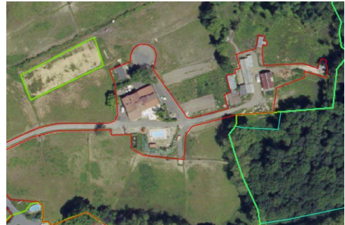
Surface artificialisée regroupant bâtiments et route d'accès