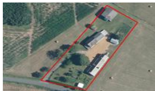
Bâtiments et jardin d'agrément