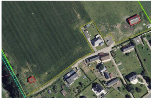
Bâtiments isolés numérisés dans l'îlot