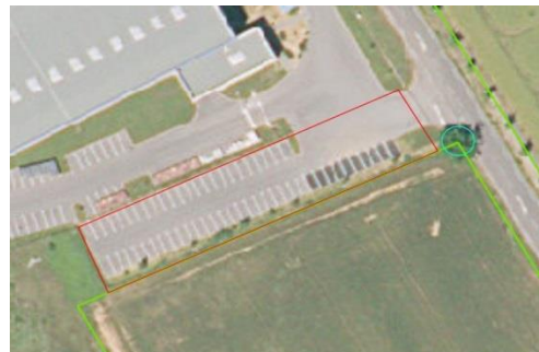
Parking numérisé en surface artificialisée