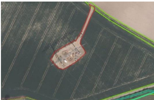
Surface artificialisée qui inclut zone d'implantation du pylône et chemin d'accès