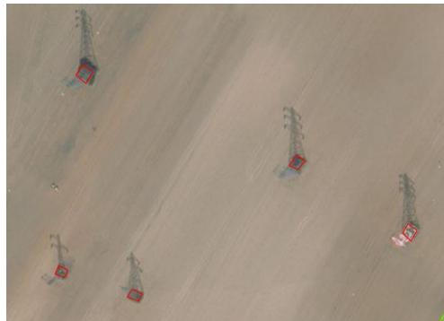
Pylônes électriques multi-pieds numérisés par leurs emprises au sol