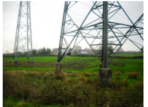
Pylônes sur le terrain