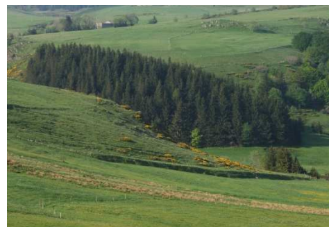
Forêt sur le terrain