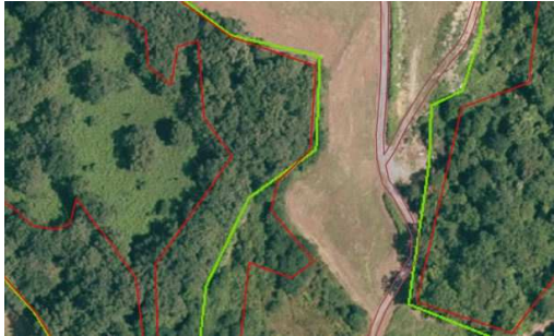
Exemples de forêts