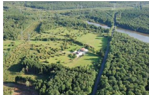
Forêt séparée par une route