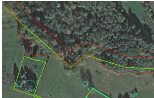
Forêt numérisée au demi-houppier