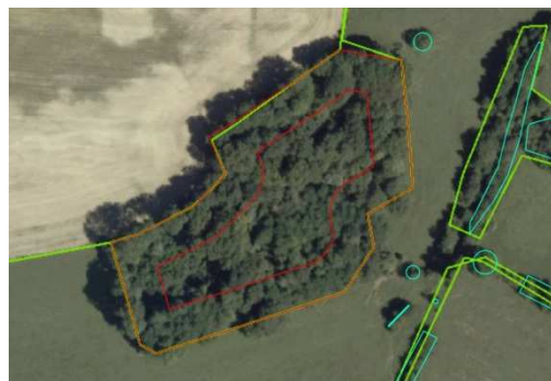
Surface supérieure à 0,5 hectares : il s'agit d'une forêt