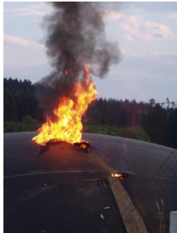
Image 10 + 11: 6. Un chiffon imbibé d'essence, enflammé, est jeté sur la membrane de stockage