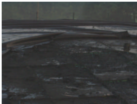
Image 18: Les pompiers interviennent Image 19: la membrane et l'isolation de la couverture brûlée.

Après 10 minutes, les pompiers ont éteint les derniers foyers de combustion. Les restes de la membrane brûlée ont été enlevés et on pouvait constater que l'isolation a été endommagée localement au niveau du foyer de la combustion.