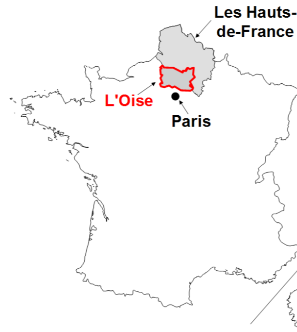
L'Oise en France