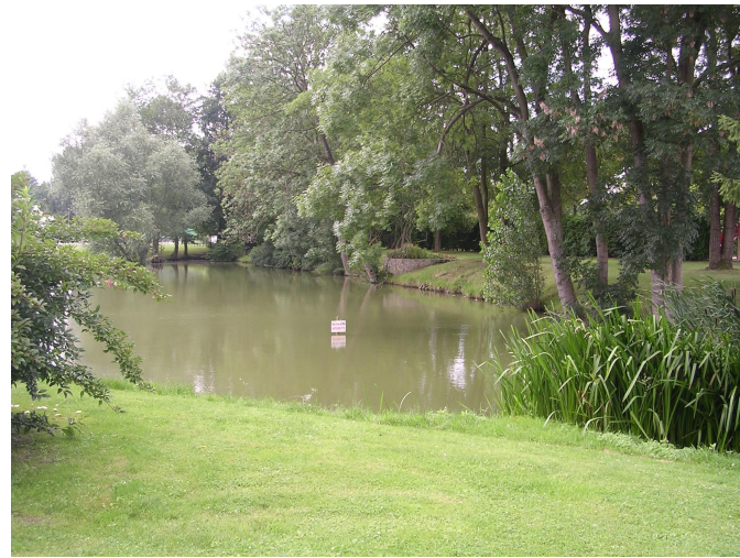
2008 : un pays renouvelé

Le « Pays Compiègnois » a vu le jour le 5 juillet 1996 par arrêté préfectoral. Son objectif premier était la coopération sur les principales questions d'aménagement du territoire, la coordination des documents de planification, notamment les Schémas de Cohérence Territoriale, et des projets de territoire. Il souhaitait développer un véritable plan de développement du Compiègnois, autour d'un projet partagé par l'ensemble des acteurs du territoire.