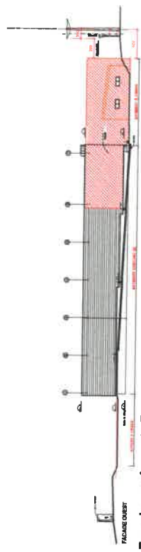
Façade rue Auguste Bonamy