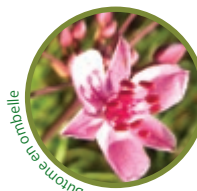
Bulme en ordelle