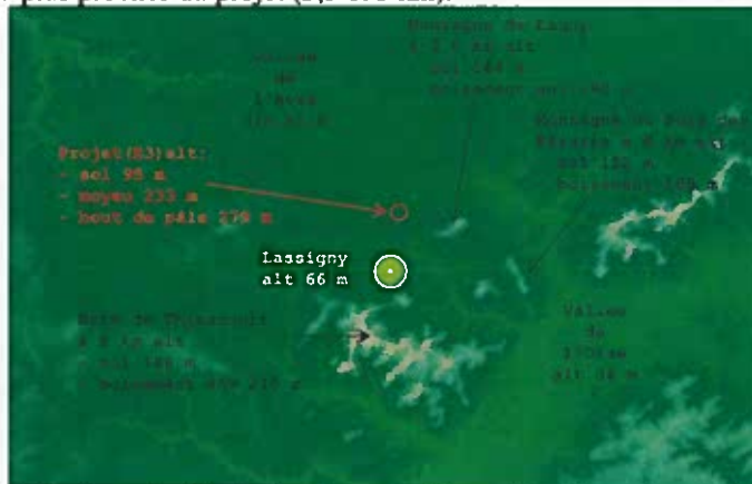
Carte du relief indiquant les altitudes du projet et des éléments identitaires du grand paysage proches

L'ensemble de ces mouvements de terrain sont boisés, ce qui les rehausse de la hauteur des boisements qui doivent être d'environ 25 m en moyenne. Ces collines revêtues présentent donc dans le grand paysage une dominance visuelle comprise entre 180 m et 210 m d'altitude. De sorte que, si jusqu'alors le paysage est couronné par ces éléments naturels, la création du projet va entraîner une dénaturation de ce caractère identitaire du paysage emblématique des Monts du Noyonnais, particulièrement au niveau de la Montagne de Lagny. En effet, la domination de ce paysage par les machines sera fortement marquée. Les éoliennes de 184,4 m de haut implantées à une altitude de 95 m au niveau de E3, vont culminer à 279 m de hauteur en bout de pale (233 m au moyeu), ce qui est nettement supérieur à l'altitude des monts du Noyonnais environnants. En prenant en compte la cime des boisements, le surplomb sera en effet d'environ 100 m pour la Montagne de Lagny et la Montagne de Ganne qui sont les plus proches du projet (3,5 et 5 km).