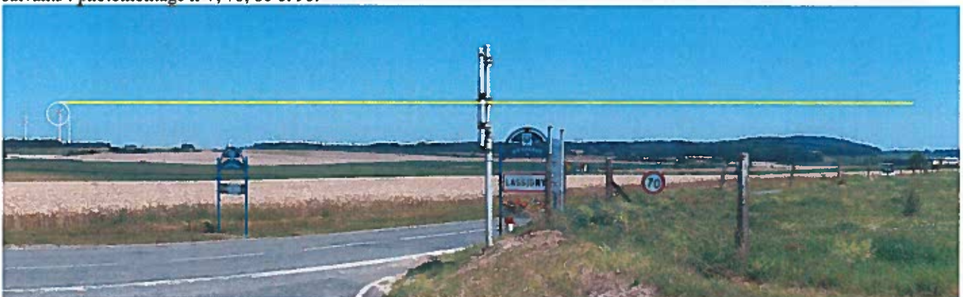
Photomontage n°7, visibilité depuis la sortie nord de Lassigny à 3,2 km avec la Montagne de Lagny (image reprise du dossier et commentée)

S'agissant de la suprématie des éléments verticaux dominant du territoire, les impacts sont visibles sur les points de vue suivants : photomontage n°7, 78, 80 et 90.