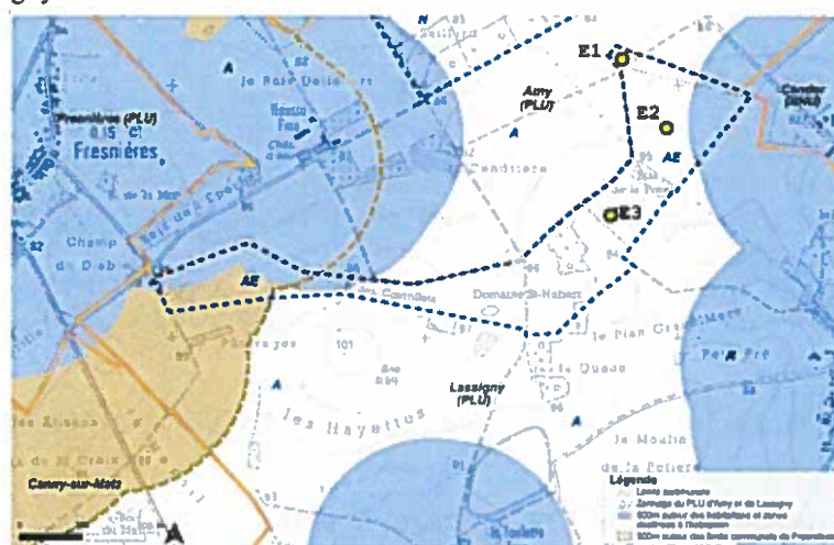
Zone AE dans laquelle le projet peut être développé compte tenu du zonage du PLU de Lassigny et du recul réglementaire aux habitations (carte reprise du dossier et commentée) :

Le porteur de projet a analysé 3 scénarios d'implantation prenant en compte de 3 à 7 éoliennes (de même modèle) situées sur le même secteur géographique au nord de Lassigny. Les scénarios sont contraints par la forme de la zone Ae du plan local d'urbanisme (PLU) de Lassigny.