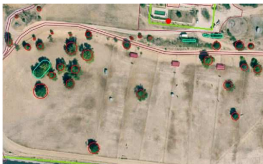
Exemple d'arbres de tailles différentes, saisis en respectant la taille des couronnes