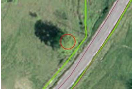
Arbre représenté par un cercle