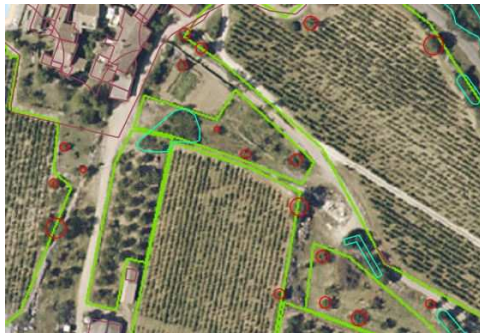
Tout arbre d'une essence non fruitière identifié dans les parcelles de vignes ou de petits fruits est saisi