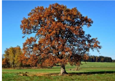
Arbre isolé sur le terrain