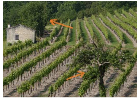
Les arbres (flèches oranges) isolés et situés en zone de vigne sont saisis