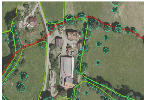
Une tranchée est saisie en fossé non maçonné (en rouge)