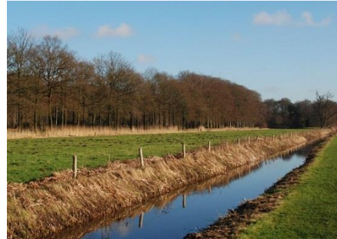
Un fossé sur le terrain