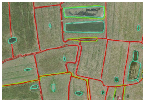
Fusion de plusieurs fossés