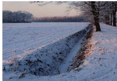
Un fossé asséché en période hivernale