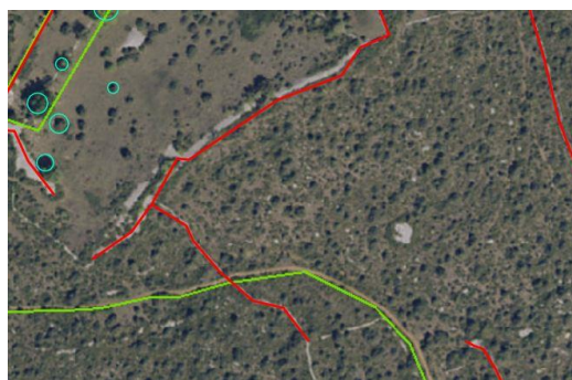
Les murs peuvent être fusionnés et appartenir à plusieurs îlots