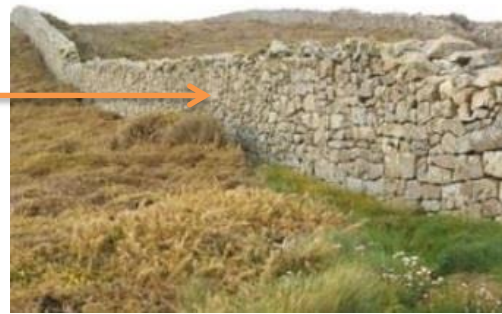
Le même mur, vu sur le terrain