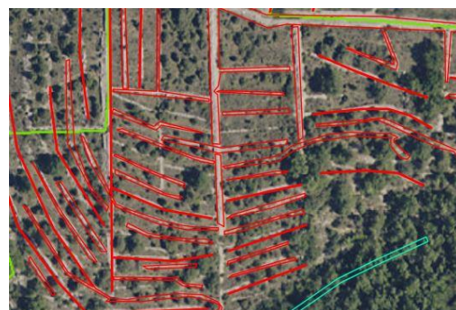
La densité des murs peut être importante