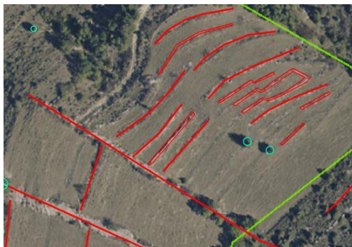
Certains murs ne sont pas rectilignes