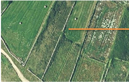
Mur traditionnel en pierre