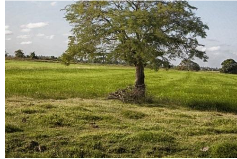
Devant l'arbre, une zone herbeuse non cultivée