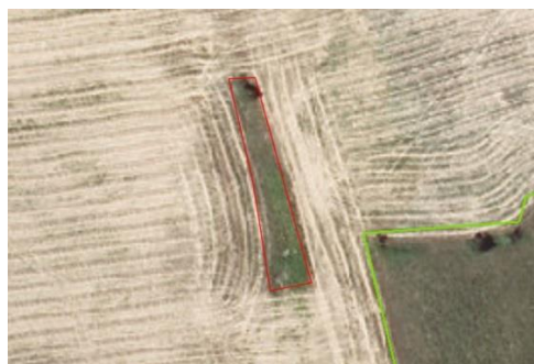
Exemple de VNANC