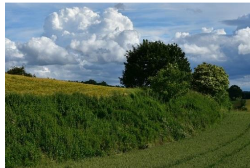
Exemple sur le terrain