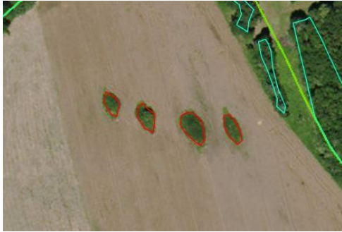
Zones herbeuses situées en terre arable