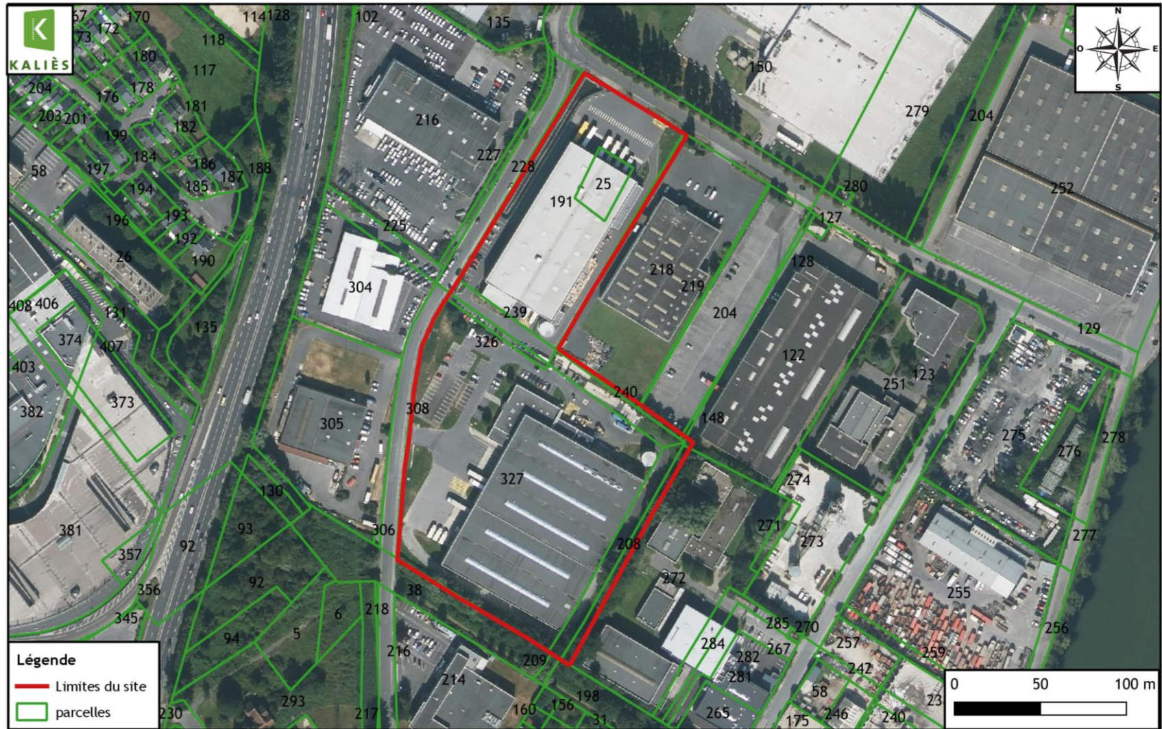
Figure 1. Plan parcellaire